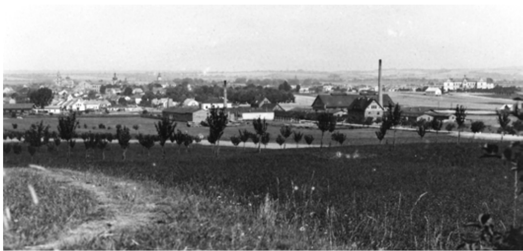
Pohled na bývalou Glancovku (vlevo) a Kopalovku sklárnu (vpravo). V pozadí vlevo je vidět kolonie sklářských domků ČB.

V roce 1924 v továrně pracovalo na 80 dělníků, avšak pro hospodářské potíže byla firma k 17. prosinci 1924 nucena zastavit provoz