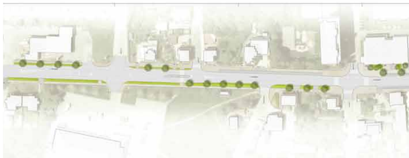
V I. etapě rekonstrukce proběhne úprava ulice v úseku od kruhového objezdu u Lidlu po křižovatku s ulicí Čsl. armády.