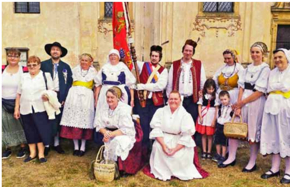
Svatojakubskoanenskou pouť zachytil objektivem Karel Hubač.

Sbor dobrovolných hasičů Mnichovo Hradiště pořádá soutěž mladých hasičů