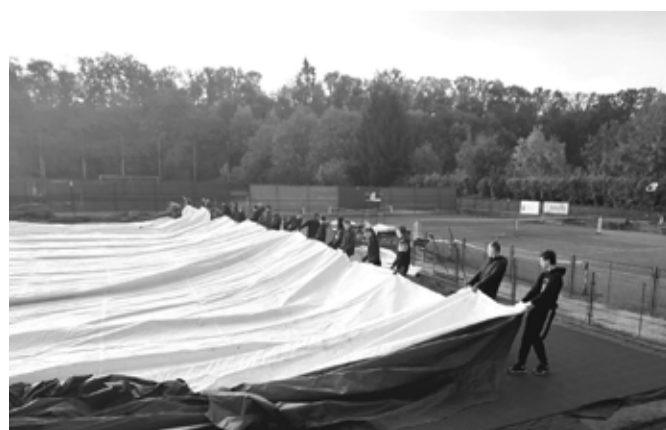
Příchod podzimu u Jizery, na pláži i na tenise.