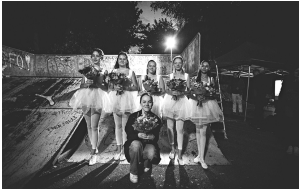
Výsledkem spojení prostoru skateparku s uměním v podání ZUŠ byl zajímavý kontrast.

Proměny sportovního areálu v místo, kde se umění potkalo s historií, se zúčastnila přibližně stovka Hradišťáků. V kulisách ne-